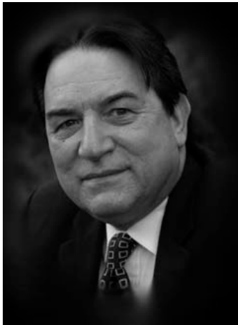
Alfred Lambremont Webre

Pero en muy poco tiempo el hombre va a aprender a usar la teletransportación cuántica y a sacar energía del espacio. Estamos en una era de transición en la que debemos decidir si vamos a la destrucción o a la evolución.