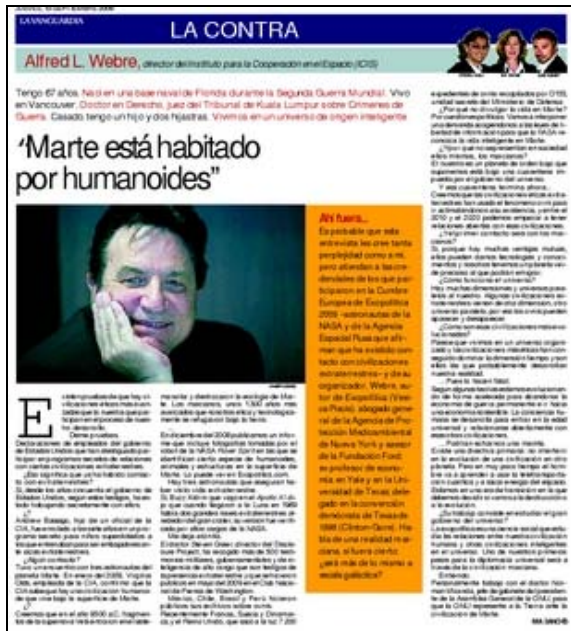
Alfred L. Webre de MARS en La Vanguardia de España en septiembre de 2009